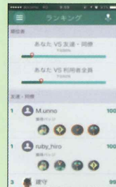
ランキング・バッジ獲得