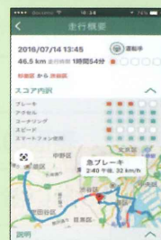
安全運転のヒント