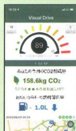
CO 2 排出削減量の可視化